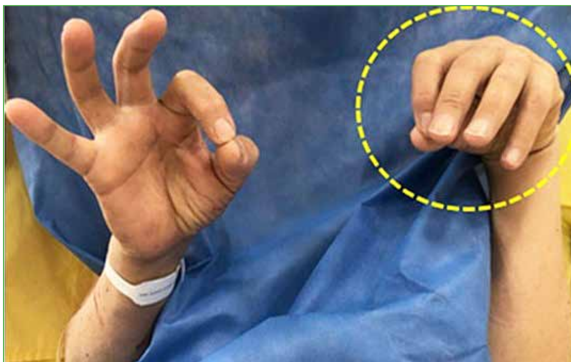
Figura 1. Imagen clínica en el preoperatorio inmediato. Se observa flexión de la muñeca y los dedos por apraxia motora del nervio radial.

Hombre de 57 años que consultó en nuestra institución, por dolor (8 puntos en la escala analógica visual) en la cara lateral del tercio medio del brazo, de inicio súbito tras realizar trabajos de albañilería con esfuerzos repetidos, de tres meses de evolución. En el examen físico, se constataron signos de parálisis motora del compartimento dorsal del antebrazo, con impotencia para la extensión de la muñeca y los dedos correspondientes al grado M0 de la escala Medical Research Council (MRC) para fuerza muscular, sin compromiso para la extensión del codo. La movilidad pasiva de codo, muñeca y mano era completa. Además, tenía hipoestesia en el dorso del antebrazo y la mano en el territorio del nervio radial. La prueba de Tinel resultó positiva a la percusión de la región lateral del brazo, principalmente en un punto ubicado a 11 cm, aproximadamente, hacia proximal del epicóndilo lateral. El cuestionario QuickDASH ( Disabilities of the Arm, Shoulder and Hand ) en la primera consulta arrojó un puntaje de 77,3 (Figura 1).