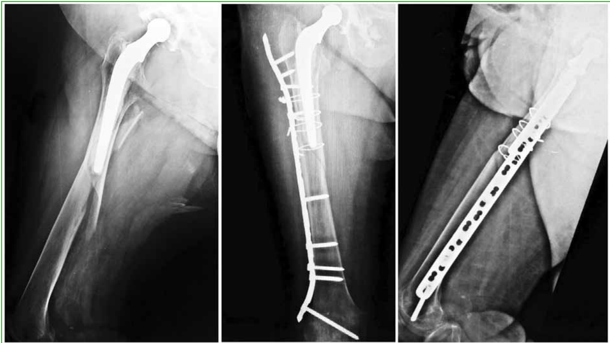
Figura 3. Reducción y osteosíntesis con placa bloqueada larga y fijación proximal mediante tornillos monocorticales y lazadas de alambre.

En nuestra serie, logramos una mejor tasa de consolidación y una tasa de fallas más baja en pacientes con una fijación proximal más estable mediante tornillos bicorticales, seguida de aquellos tratados con tornillos bicorticales y lazadas de alambre, en comparación con aquellos en los que se usaron tornillos monocorticales o solo lazadas (Figura 3). Además, registramos una tasa de fallas más alta cuando utilizamos solo fijación proximal con alambres en pacientes con fracturas periprotésicas Vancouver tipo B1, a pesar de no obtener una relación significativa entre ambos, existiría una tendencia a la falla al utilizar esta configuración que resulta la de menor estabilidad en el montaje.