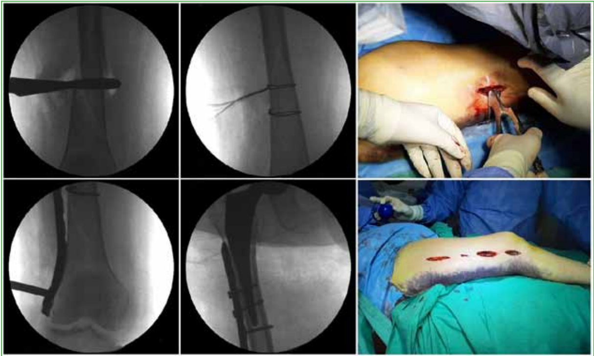
Figura 2. Reducción y osteosíntesis de una fractura periprotésica de cadera mediante la técnica MIPO.

La adición de placas de aloinjerto puede proporcionar estabilidad mecánica inmediata y mejorar la curación de las fracturas y aumentar la reserva ósea. 7-9 Haddad y cols. informaron una tasa de curación del 98% de las 40 fracturas periprotésicas femorales tratadas con aloinjerto solo o junto con una placa, los cuales cumplían una función mecánica y una función biológica que condujeron a una alta tasa de consolidación. Sin embargo, requirieron de una gran exposición quirúrgica con disección de tejidos blandos, perturbando el suministro de sangre en las fracturas. 7 En nuestra serie, se habían utilizado placas y aloinjerto en el 9,4% de los pacientes y el tiempo promedio de consolidación fue de 5.83 meses. En 2001, Krettek y cols. 10 describen la técnica de “osteosíntesis percutánea mínimamente invasiva” ( minimally invasive plate osteosynthesis , MIPO) que incorpora reducción indirecta e inserción percutánea de placas y tornillos que reducen, al mínimo, la extensión de la disección de tejidos blandos (Figura 2). Con este avance tecnológico sumado a la técnica MIPO, los cirujanos disponen de los principios de la fijación interna y de la compresión dinámica en el mismo implante; de esta manera, disminuyen el sangrado, las grandes disecciones y el tiempo quirúrgico y, en consecuencia, las complicaciones derivadas. 10-12