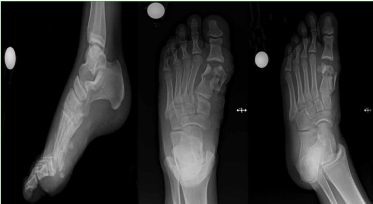
Figura 1. Radiografías anteroposterior, lateral y oblicua del pie derecho que muestran una fractura intrarticular cerrada de la falange distal del hallux, una fractura conminuta del primer metatarsiano y un fragmento óseo avulsivo en el dorso del hueso navicular.