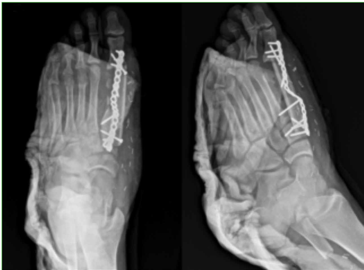
Figura 3. Radiografías anteroposterior y oblicua del pie derecho, que muestran el resultado posoperatorio.

El paciente evolucionó adecuadamente tras la operación. Continuó con analgesia que logró un buen control del dolor. Se avanzó con dieta. Se progresó con terapia e incentivo respiratorio y se inició la disminución progresiva de oxígeno, con buena tolerancia hasta que se logró el retiro al cuarto día.