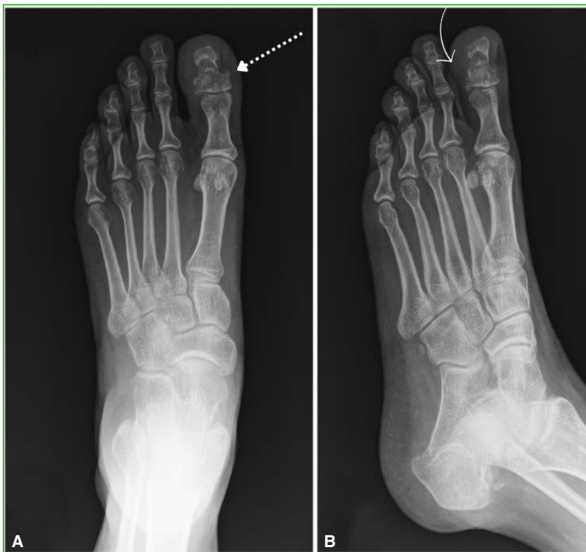
Figura 4. Radiografías de pie derecho. A. Proyección anteroposterior. Avanzado proceso de consolidación (flecha blanca punteada). B. Proyección oblicua. No hay recidiva tumoral (flecha curva blanca).

Tras 4 meses de seguimiento clínico, el paciente no ha tenido dolor ni molestias mecánicas al emplear calzado, aunque tiene solo cambios de coloración ungueal. Desde el punto de vista radiológico, la consolidación es avanzada, y no ha tenido recidiva (Figuras 4 y 5).