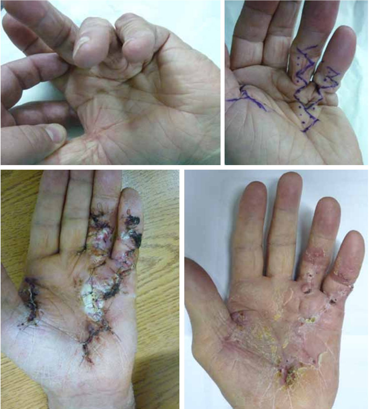
Figura 2. Secuencia evolutiva de caso con afección del 4.º y 5.º rayos. Diseño de colgajo en la 4.ª comisura. Necrosis distal parcial y buena evolución con cierre de técnica de palma abierta.

La prolongación proximal se puede continuar según técnica en zigzag, en V-Y o en forma transversal. A nivel distal, el abordaje de cada dedo se realiza según la técnica de Bruner o la preferencia del cirujano.