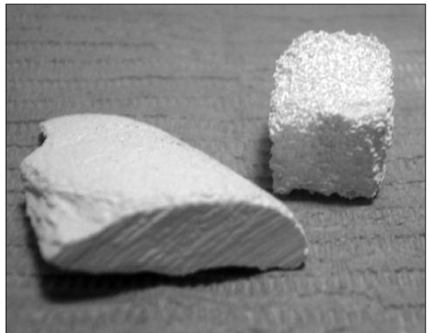
Figura 1. Hidroxiapatita densa de tipo cortical e hidroxiapatita esponjosa.

Hoy se cuenta con diferentes tipos de injertos, los cuales se clasifican según su origen. Pueden distinguirse los extraídos del propio paciente (autólogos); los provenientes de otro individuo de la misma especie, pero de dife-