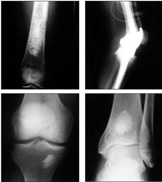
Figura 3. Microscopia electrónica de barrido (SEM). A. Biocerámico. B. HA-40 \beta TCP. C. Porosidad controlada e interconectada en un biocerámico.

a la función, los biocerámicos ( \beta -TCP y hidroxiapatita natural o sintética) tienen sólo la propiedad de osteoconducción; los demás componentes esenciales para la neoformación del tejido óseo (células y señales bioquímicas) son aportados por el propio organismo en el sitio de la lesión. 7,15-17