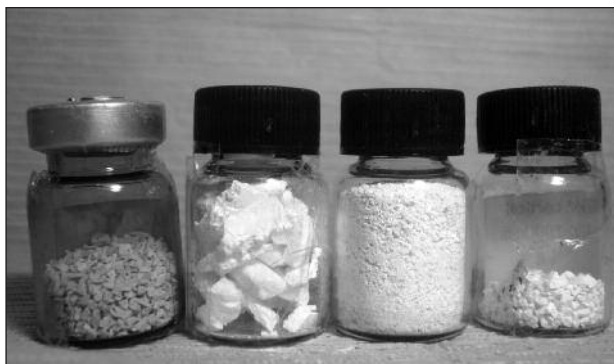
Figura 5. Diferentes tipos de biocerámicos. De izquierda a derecha: HA-20βTCP, HA cortical, HA 300 a 600µm - HA-40βTCP.

cementos de fosfato de calcio que fraguan en medio fisiológico cuando se los mezcla con soluciones ácidas. Estos cementos sustituyen a los de sulfato de calcio y se emplean para el relleno de fisuras en traumatología, cirugía maxilofacial y neurocirugía; además, cuentan con la característica de transformarse, una vez fraguados, en hidroxiapatita en el medio fisiológico. 19 La fase β es biodegradable por una combinación de disolución fisicoquímica y fragmentación, que implica la sustitución paulatina del material por tejido óseo. Esta fase suele presentarse en forma de granos porosos, que se absorben a mayor velocidad que la hidroxiapatita debido a su alta solubilidad en el medio fisiológico. Se emplean en odontología y traumatología como materiales de sustitución. Los productos comerciales más representativos son: BIORESOB ® , CHRONOS ® , CEROS ® , CERASORB ® , VITOSS ® , ODONTIT ® -BCTP 300/1000.