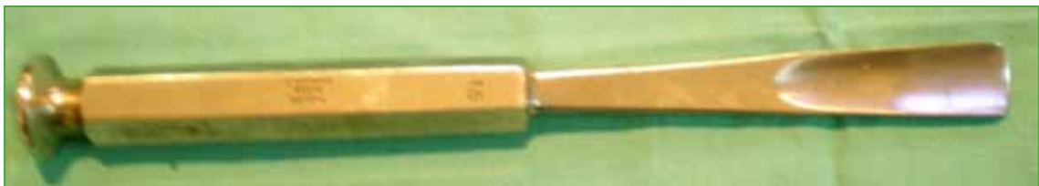
Figura 3. Escoplo gubia utilizado para la toma de injerto óseo de cresta ilíaca.