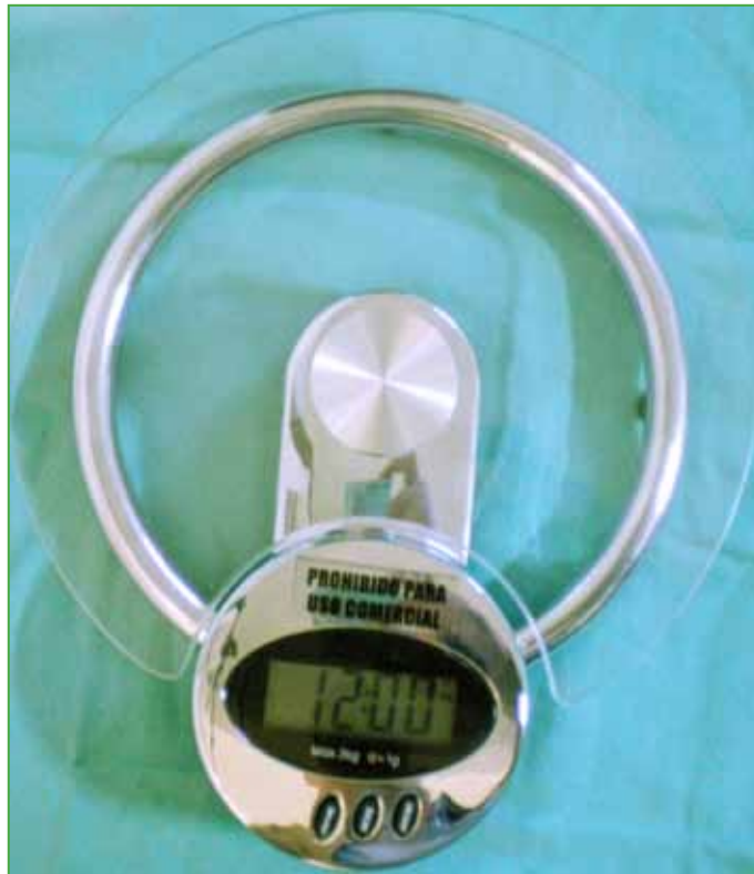
Figura 4. Balanza digital para pesar el injerto óseo tomado de cresta ilíaca y del campo.

Se cronometró la duración del procedimiento desde el comienzo del tiempo óseo hasta la obtención completa del material esponjoso. Se detallaron las complicaciones intraquirúrgicas de la técnica.