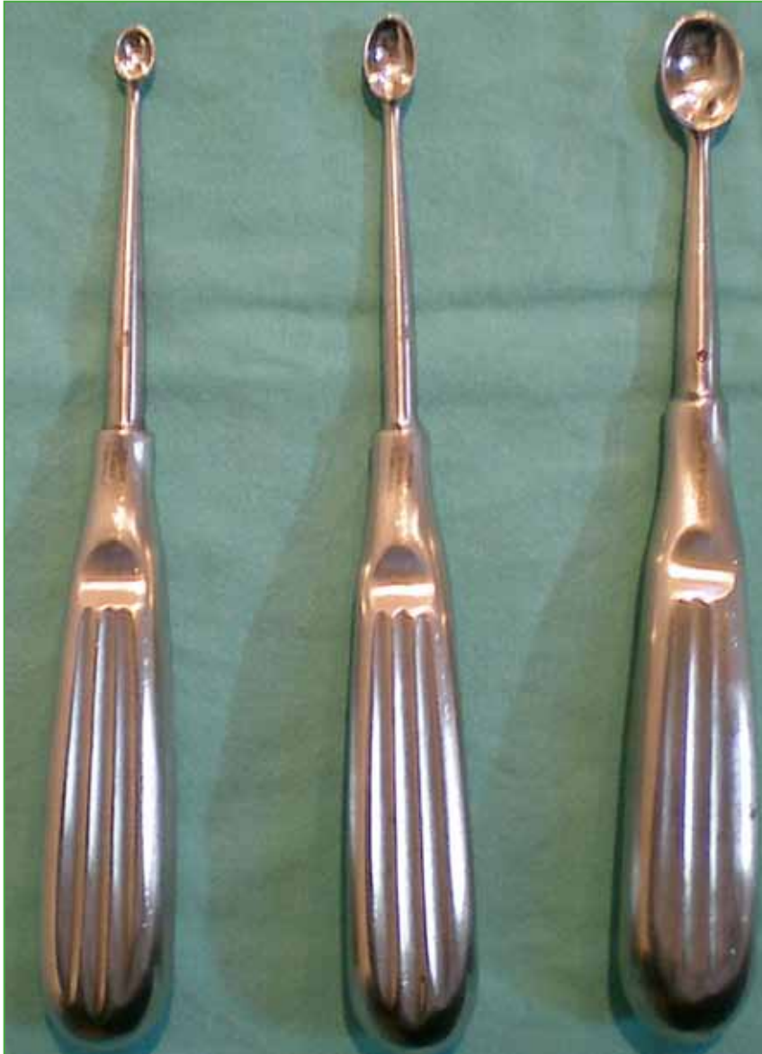
Figura 2. Tipos de curetas utilizadas para la toma de injerto óseo de cresta ilíaca.