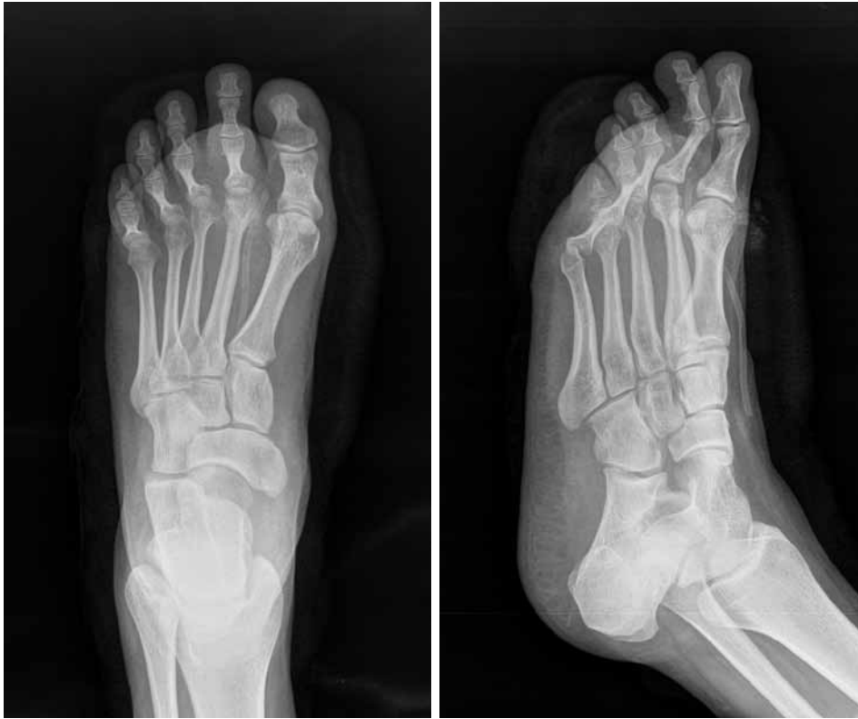
▲ Figura 5. Radiografías posoperatorias.

distintas características patológicas. Esta clasificación incluye un estadio inicial en el que se observa una patología localizada en la sinovial sin cuerpos libres articulares, un estadio intermedio en el que se observan ambas características con predominio de alguna de las dos y un tercer estadio en el que predominan los cuerpos libres articulares, sin patología sinovial detectable. Lo más frecuente, al momento del diagnóstico, es la presencia de múltiples nódulos cartilaginosos y, en algunas ocasiones, un grado variable de destrucción articular. Con menor frecuencia esta metaplasia puede aparecer en la membrana sinovial