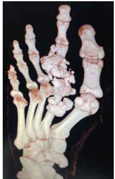
Figura 3. Tomografía computarizada preoperatoria.