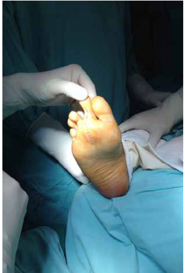
▲ Figura 1. Imagen preoperatoria.