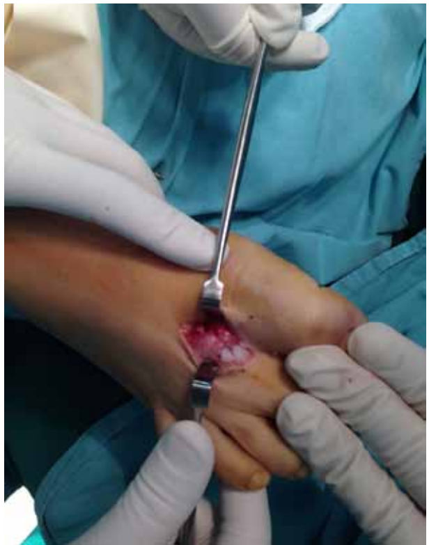
Figura 4. Imagen intraoperatoria. Doble abordaje.