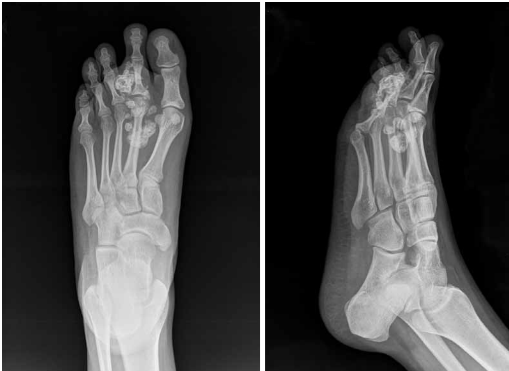
▲ Figura 2. Radiografías preoperatorias.